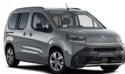
KCA Ezüst metálfényezés Bruttó 200000 Ft