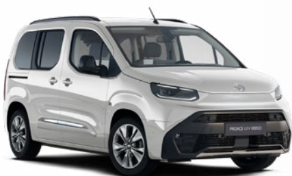
EPR Hófehér alapszín felár nélkül