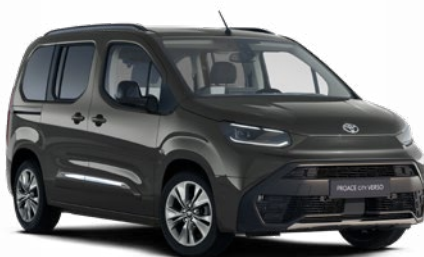
EVL Sóljomszürke metálfényezés Bruttó 200000 Ft