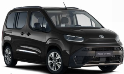
KTV Éjfékete metálfényezés Bruttó 200000 Ft