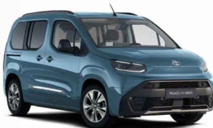
KJW Szürkéskék metálfényezés Bruttó 200000 Ft

A karosszéria színe a felszereltségi szinttől is függhet.