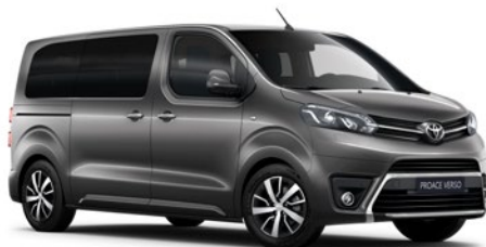
EVL Súlyomszürke Metálfényezés Bruttó 200 000 Ft