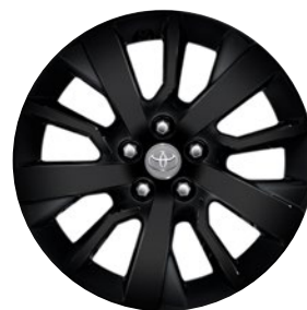
17" fekete könnyűfém keréktárcsák