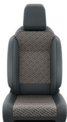
Fekete szövet barna betétekkel Alapfelszereltség Family modelleken