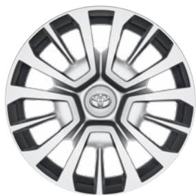
16" / 17" acél keréktárcsák dísz tárcsával