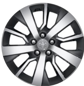
17" könnyűfém keréktárcsák