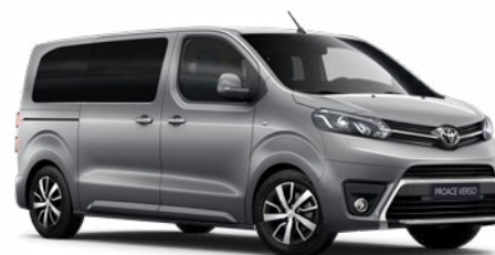
KCA Ezüst Metálfényezés Bruttó 200 000 Ft