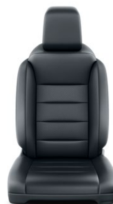
Fekete bőr Alapfelszereltség VIP modelleken