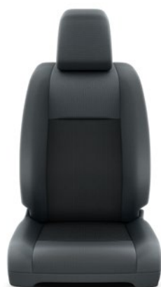
Fekete szövet ülésborítás Alapfelszereltség Combi modelleken