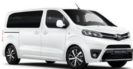
EPR Hófehér felár nélkül