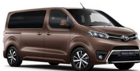
KCM Gesztenye barna Metálfényezés Bruttó 200 000 Ft

A karosszéria színe a felszereltségi szinttől is függhet.