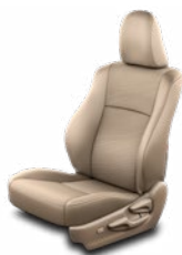
Bézs színű szövetkárpit Alapfelszereltség a Prado Family felszereltségi szinten