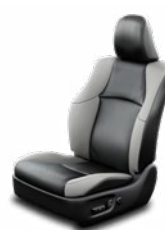
Fekete bőrülés szürke betétekkel Alapfelszereltség az Executive felszereltségi szinten