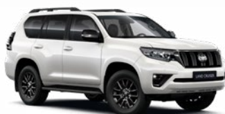
070 Gyöngyfehér* 400 000 Ft