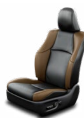
Fekete bőrülés barna betétekkel Alapfelszereltség az Executive felszereltségi szinten