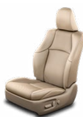
Bézs bőrkárpit (természetes / szintetikus bőr) Alapfelszereltség az Invincible felszereltségi szinten