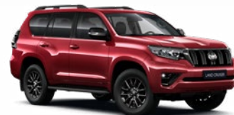
3R3 Barcelona vörös* 330 000 Ft