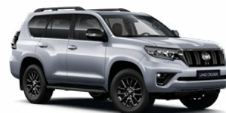
1F7 Ultraezüst* 330 000 Ft