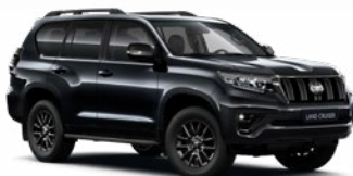
218 Fekete gyöngyház* 330 000 Ft