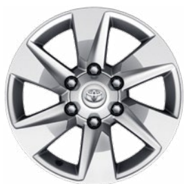
17" könnyűfém keréktárcsa Alapfelszereltség a Prado Family felszereltségi szinten