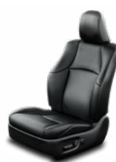
Fekete bőrkárpit (természetes / szintetikus bőr) Alapfelszereltség az Invincible felszereltségi szinten