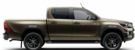
6X1 Barnászöld Metálfényezés nettó 255 000 Ft bruttó 323 850 Ft