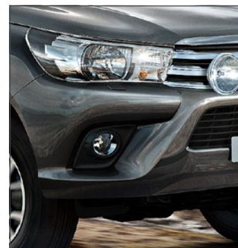
Ködlámpák 309 600 Ft