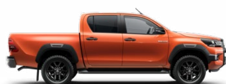
4R8 Narancsmetál Metálfényezés nettó 255 000 Ft bruttó 323 850 Ft

* Szimplakabinos változatok esetén nem érhető el.