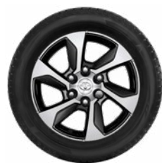
Komplett téli szerelt kerék szett (4 db) 17"-os téli szerelt kerék alufelnivel és Bridgestone LM005 gumiabronccsal Akción ár: 673 100 Ft