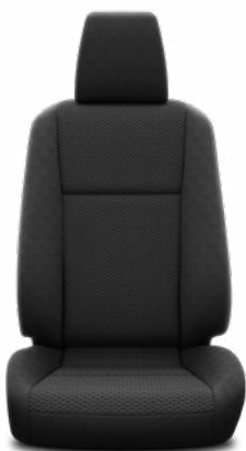
Ovális mintázatú fekete szövet Alapfelszereltség a Live modellváltozaton