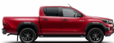
3T6 Lávavörös Metálfényezés nettó 255 000 Ft bruttó 323 850 Ft