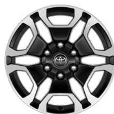
18" fekete, csiszolt felületű könnyűfém keréktárcsa (6 küllős) Alapfelszereltség az Executive modellváltozaton