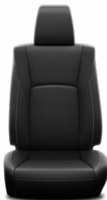
Fekete bőr Alapfelszereltség az Executive Leather modellváltozaton