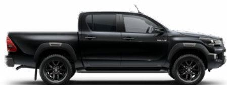
018 Fekete gyöngyház Metálfényezés nettó 255 000 Ft bruttó 323 850 Ft