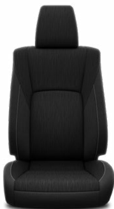
Függőleges mintázatú fekete szövet Alapfelszereltség az Active és Executive modellváltozaton