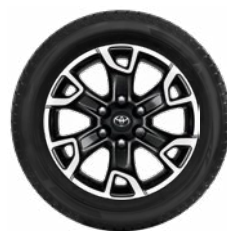
Komplett téli szerelt kerék szett (4 db) 18"-os téli szerelt kerék alufelnivel és Continental Winter Contact TS850 gumiabronccsal Akción ár: 664 100 Ft

Ha új autójához téli szerelt kereket vásárol, akkor 3 évig tartó (a nyári gumiabroncsra is vonatkozó) gumibiztosítást adunk ajándékba! Az árakkal és a további részletekkel kapcsolatban érdeklődjön márkakereskedőjénél!