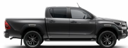
1G3 Hamuszürke Metálfényezés nettó 255 000 Ft bruttó 323 850 Ft