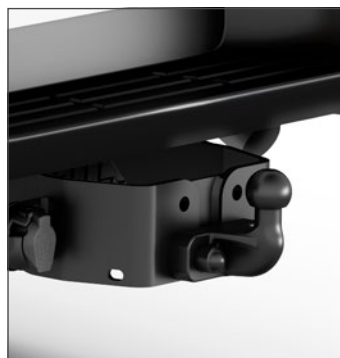
Peremre rögzített vonóhorog Vonóhorog szett 7 pólusú kábellel 276 000 Ft (márkakereskedői szerelés)