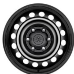
17" fekete acél keréktárcsa Alapfelszereltség a Live extra- és duplakabinos modellváltozaton