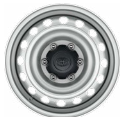
17" ezüst színű acél keréktárcsa Alapfelszereltség a Live szimplakabinos modellváltozaton