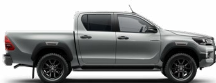
1D6 Ezüstmetál Metálfényezés nettó 255 000 Ft bruttó 323 850 Ft