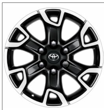
18" fekete, csiszolt hatású könnyűfém keréktárcsák 418 800 Ft