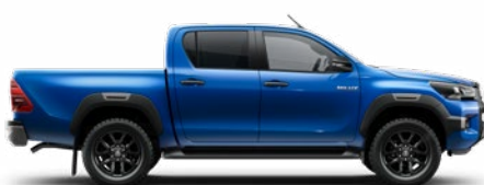
8X2 Vízkék Metálfényezés nettó 255 000 Ft bruttó 323 850 Ft