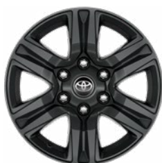
17" sötétszürke könnyűfém keréktárcsa (6 küllős) Alapfelszereltség az Active modellváltozaton