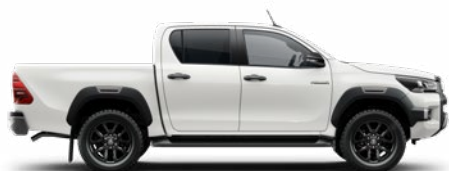
040 Hófehér Alapfényezés felár nélkül