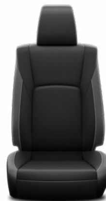
Kéttónusú perforált bőr Alapfelszereltség az Invincible modellváltozaton