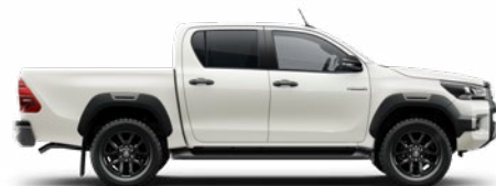
089 Gyöngyfehér* Metálfényezés nettó 310 000 Ft bruttó 393 700 Ft