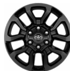
18" fekete könnyűfém keréktárcsa (5 küllős) Alapfelszereltség az Invincible modellváltozaton